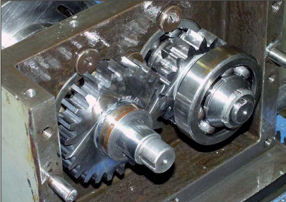
測試裝置(兩個互鎖齒輪)